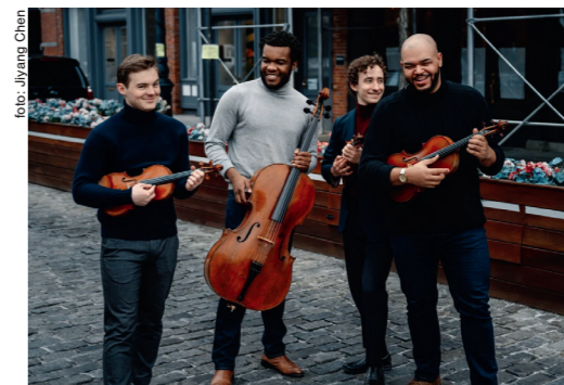
Isidore String Quartet

Van de klassieke verfijning van Joseph Haydn tot de warme romantiek van Johannes Brahms en de eigentijdse klankwereld van Billy Childs: dit programma verbindt traditie en vernieuwing. Met gepaste trots presenteren we onze nieuwe Rising Stars , het Isidore String Quartet, winnaar