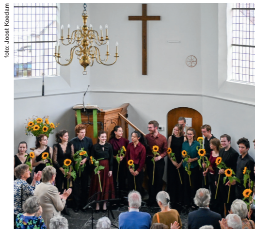
Jong Talent Tournee

Tijdens het festival kunt u genieten van de Jong Talent Tournee door deelnemers aan de masterclasses. Deze concerten vinden plaats op diverse sfeervolle locaties in het land tegen een